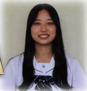
東陽中出身 ダンス部