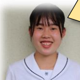
早島中出身 吹奏楽部