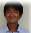
福浜中出身 ソフトテニス部