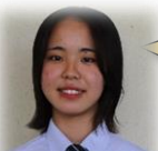
灘崎中出身 ダンス部