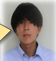
芳泉中出身 バスケット部