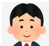
御南中出身 演劇部