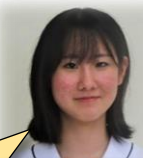
八浜中出身 ESS 部