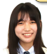
荘内中出身 ダンス部