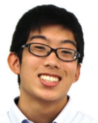
光南台中出身 演劇部