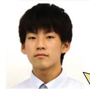
操南中出身 サイエンス部

①校外活動で、モデルロケットの大会に参加しており、それに惹かれ、自分も出たいと思った。 ②先輩や先生方にいろいろな質問をした際に、対応がとてもすばらしく、温かい。また、クラス同士の仲がとても良く、玉高に来て良かったと思う。