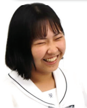
琴浦中出身 陸上競技部

①玉野高校は、選択コースがいろいろあることを知り、自分に合ったコースが見つけれそうだった。 ②山と海に囲まれていて、自然豊かな環境で勉強できるのでとても良い。実際玉野高校に入学してみても、先生方が親身になって話を聞いてくれて、自分の進路について深く考えることができた。