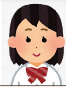
妹尾中出身 卓球部

①先生に勧められたから。 ②優しくいい人ばかりですぐ友だちができた。学校外の人と関わる機会が多くていろいろなことが学べる。先生も話しやすい先生が多い。