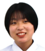
児島中出身 卓球マネージャー ・軽音楽部