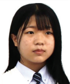
福田中出身 サッカー部 マネージャー

①学校の雰囲気は温かく、行事も活発で楽しそうだった。 ②同級生や先輩が優しくフレンドリーで、先生方もおもしろい人が多いこと。勉強と部活動で忙しいときもあるが、毎日楽しく充実した生活を送れている。