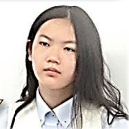
桑田中出身 演劇部

①今所属している演劇部が、たくさんの大会に出て賞を取っている。行事が楽しそうだった。 ②部活動の先輩方が優しく接しやすい。友だちが作りやすい。自分の個性が表せる。いろいろな経験をすることができる。