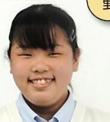
山田中出身 バレーボール部