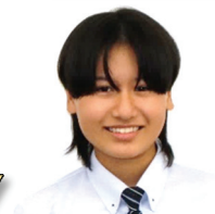
東兎中出身 軽音楽部

①緑が多く、自然がいっぱい。自分に合った勉強ができる。 ②部活動と勉強の両立ができて、充実した毎日を過ごせている。自分が頑張った分、先生たちが褒めてくれて支えてくれる。生徒を「熱く温かくいきいきと」成長させてくれる学校！