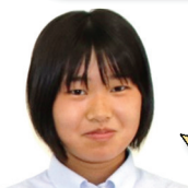
瀬崎中出身 ハンドボール部