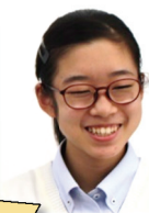
早島中出身 茶道部