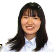
玉中出身 バスケットボール部

①部活動と勉強の両立ができる。玉野高校は2年次から5つの学系に分かれるため、自分に合った進路を見つけられると思った。 ②先生と生徒との距離が近く、勉強でわからないところや不安に思っていることを気軽に相談できる。先輩も優しく、困ったときに優しく教えてくれる。