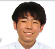
八浜中出身 演劇部