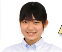
日比中出身 ダンス部

①周りが山や海などの自然に囲まれていて、落ち着いて勉強できると思った。 ②先生たちが優しく、話しかけてくれるので距離を感じない。部活動がしっかりと取り組める。周りが自然いっぱい落ち着いて勉強や生活ができる。