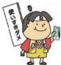
OKAYAMA スマホサミット 公式キャラクター 「スマ太郎」